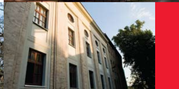
Siedziba Filharmonii Zabrzeńskiej