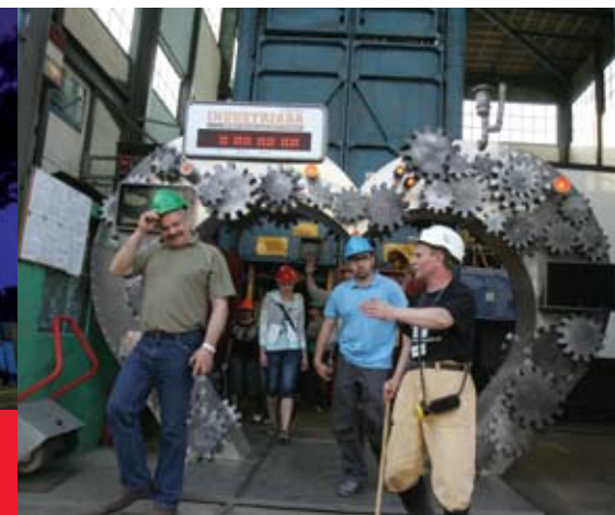
Święto szlaku zwane „Industriadą” przyciąga do Zabrza turystów z całej Polski

Muzeum Górnictwa Węglowego - jedyne tego typu w Europie, jest kolejnym ważnym miejscem na Szlaku. Natomiast Szyb „Maciej” zasłynął nie tylko z czynnej maszyny wyciągowej i wieży widokowej, ale także z krystalicznie czystej wody, z której korzystają turyści i mieszkańcy Zabrza. Niesamowity Szlak Zabrzeńskich Zabytków Techniki uzupełniają zachowane w niezmiennym kształcie XIX wieczne osiedla górnicze Borsiga, Ballestrema i Donnersmarcka ze stalowymi domami, piękną architekturą i zielenią.