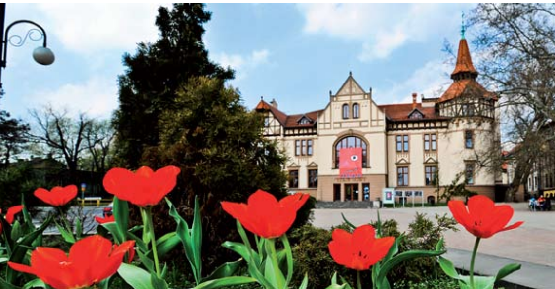
Dawne kasyno i biblioteka przy Hucie Donnersmarcka pełnią dzisiaj funkcje kulturalne. Na zdjęciu Teatr Nowy, a po prawej siedziba Filharmonii Zabrzeńskiej.

Ciągle rozwija się działalność Zabytkowej Kopalni Węgla Kamiennego GUIDO, a cykl „Sztuka na poziomie” przyciąga tłumy nie tylko turystów. Od 15 lat wielką atrakcją Zabrza jest Skansen Górniczy Królowa Luiza z unikatową, czynną, parową maszyną wyciągową.